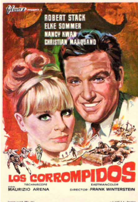
Héllo Nguane moderou a apresentação de "Uma Ficção Inútil-A Resposta"

uma cena de um comboio em rápido movimento. Logo vem o cenário onde o protagonista - o fotojornalista ocidental Cliff Wilder (Robert Stack) observa e fotografa, em segredo, muitas mulheres "sensuais" a trabalhar no campo e sob a guarda dos soldados "decadentes" que falam em mandarim.